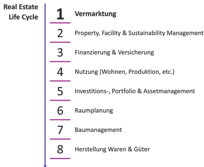
Abbildung 2: Ausbreitung von Plattformen und Ökosystemen entlang des Immobilienlebenszyklus

Im ganzen Planungs- und Baubereich (Baumanagement) haben sich noch wenige Plattformen und Ökosysteme etabliert. Verschiedenste Lösungen sind am Entstehen, wie beispielsweise solche mit dem Fokus auf die Immobilienentwickler. Diese vereinfachen den Entwicklungsprozess durch integrierten Zugriff auf öffentliche Karten und Pläne und durch Visualisierung potenzieller Gebäudevolumen in der digital gebauten Umgebung und ermöglichen das Potenzial einer Parzelle schnell zu erkennen. Auch für die Digitalisierung des mühsamen Baubewilligungsprozesses sind erste Lösungen erkennbar.